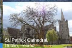
St. Patrick Cathedral, Dublin, Ireland