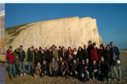
Seven Sisters, Brighton, England