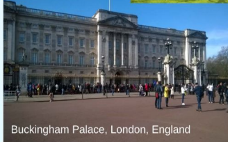
Buckingham Palace, London, England